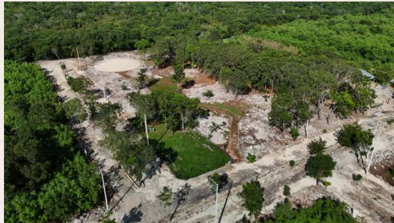
Parque El Bosque (etapa 1)