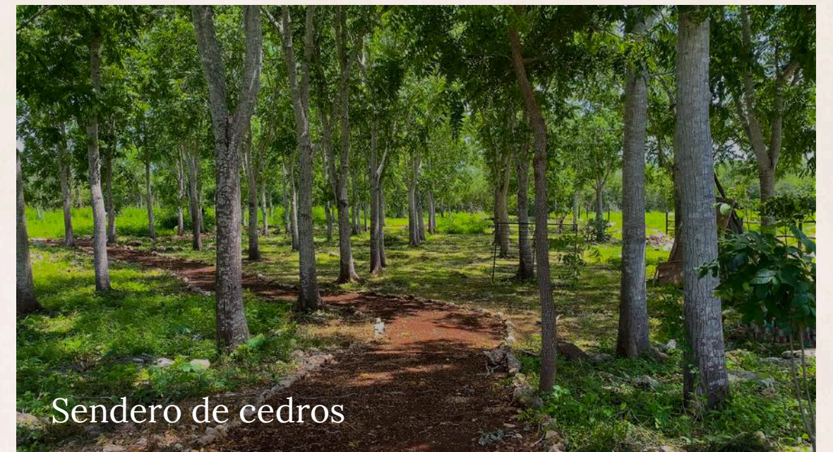
Sendero de cedros