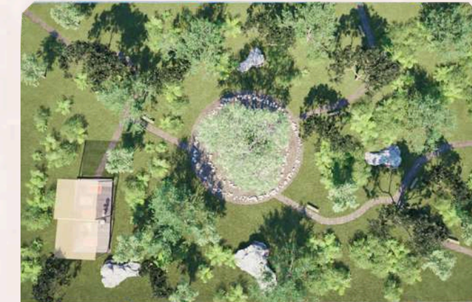
Parque Semilla (etapa 2)