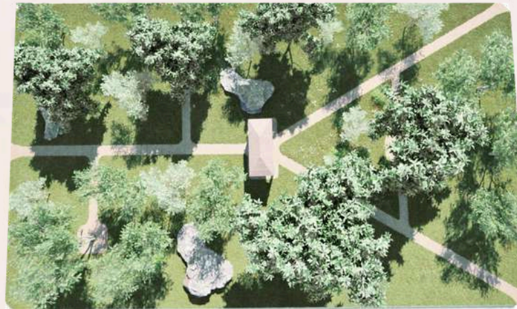
Parque Becheii (etapa 2)