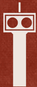
Murete y acometida