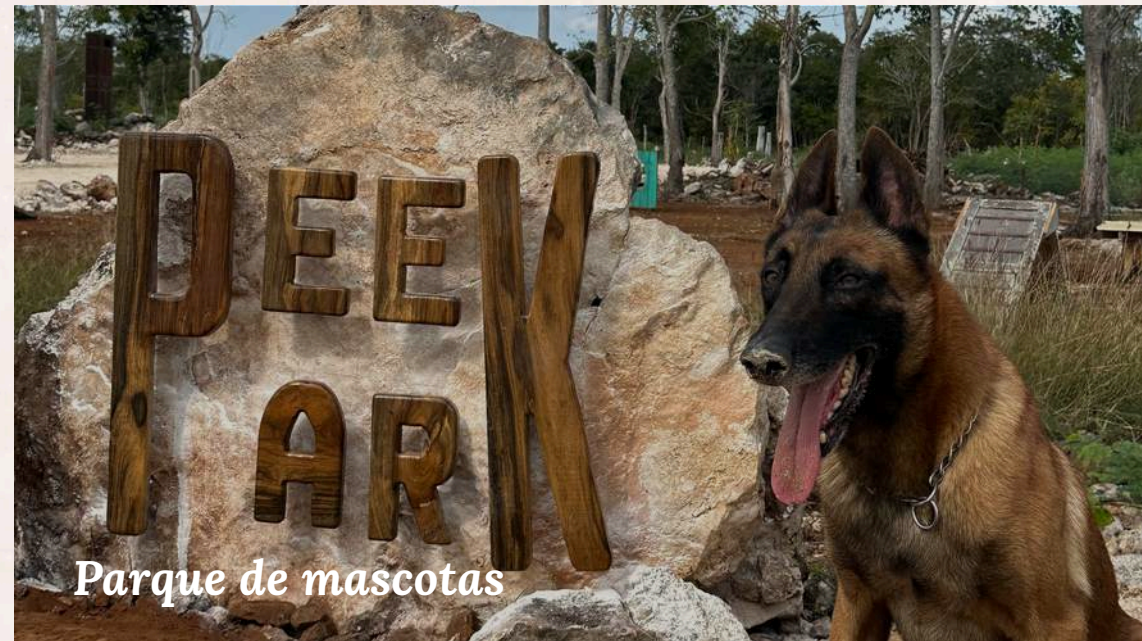
Parque de mascotas