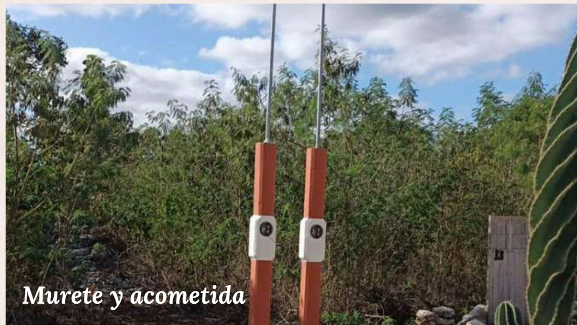
Murete y acometida