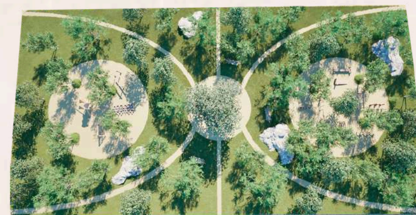
Parque Zensah (etapa 3)