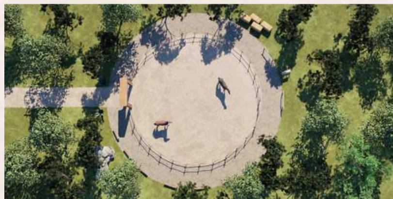
El Ruedo Aina (etapa 2)

Espacio ecuestre para actividades con caballos